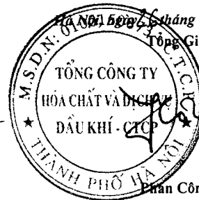
Phan Công Thành