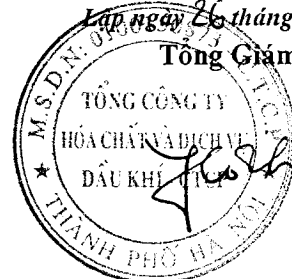
Phan Công Thành